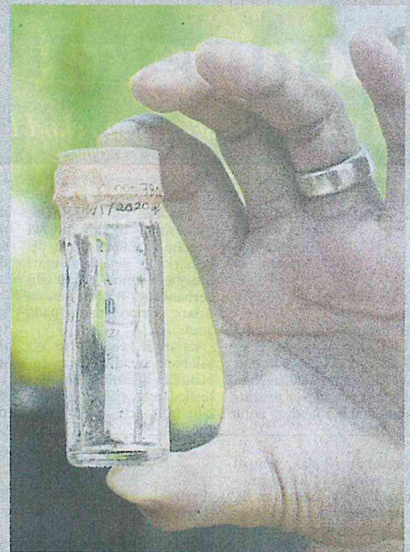
SAMPEL rokok yang diambil sebagai bukti operasi.

"Dalam tempoh itu, mana-mana pemilik premis yang gagal meletakkan papan tanda larangan merokok sudah diberikan amaran dan sepatutnya mereka sudah sedia maklum mengenai penguatkuasaan yang bermula hari ini