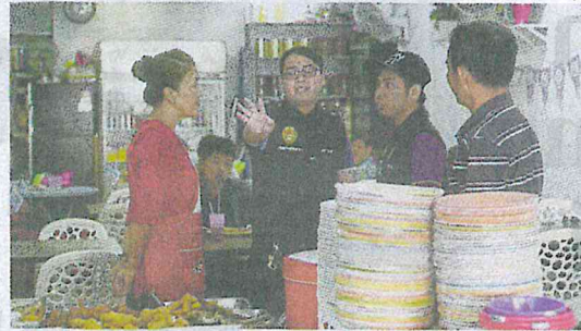
Operasi larangan merokok di sekitar Jelutong, Georgetown, semalam.