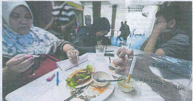
Pegawai Penguatkuasa Jabatan Kesihatan mengeluarkan saman terhadap pelanggan yang gagal mematuhi larangan merokok di Jalan Raja Muda Abdul Aziz, Kuala Lumpur, semalam.

"Sejumlah 31 notis dikeluarkan pada hari pertama pen-