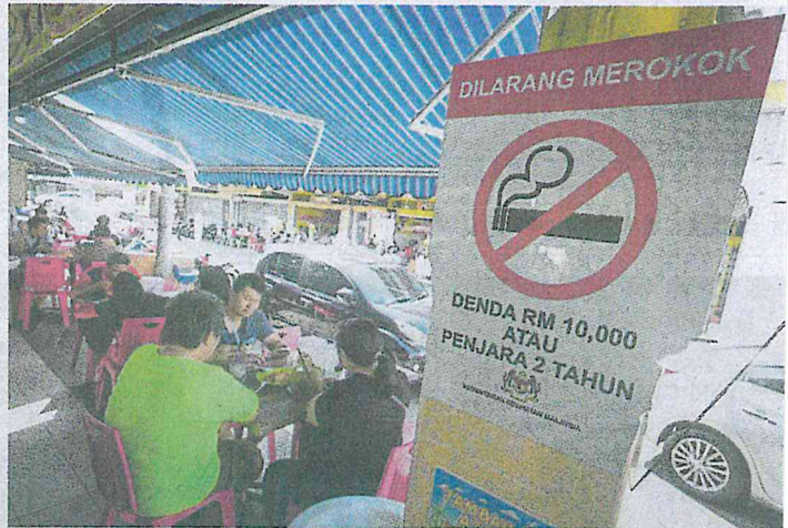
LARANGAN merokok dan rokok elektronik di premis makan berkuat kuasa, semalam.

"Kita tidak menerima maklum balas mengenai restoran yang dikenakan saman seperti diumumkan kerajaan. Hanya satu premis setakat ini yang dikompaun kerana tidak meletakkan tanda amaran larangan merokok di Seremban," katanya.