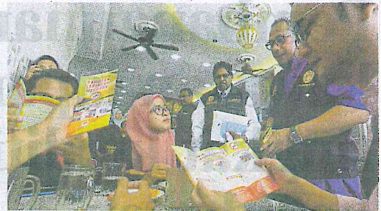
Pegawai Kesihatan Daerah Seremban menyebarkan risalah di Jalan Tuanku Munawir, semalam.