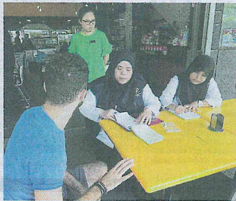
ANGGOTA pkuat kuasa mengeluarkan notis saman kepada pelancong warga Mesir, semalam.