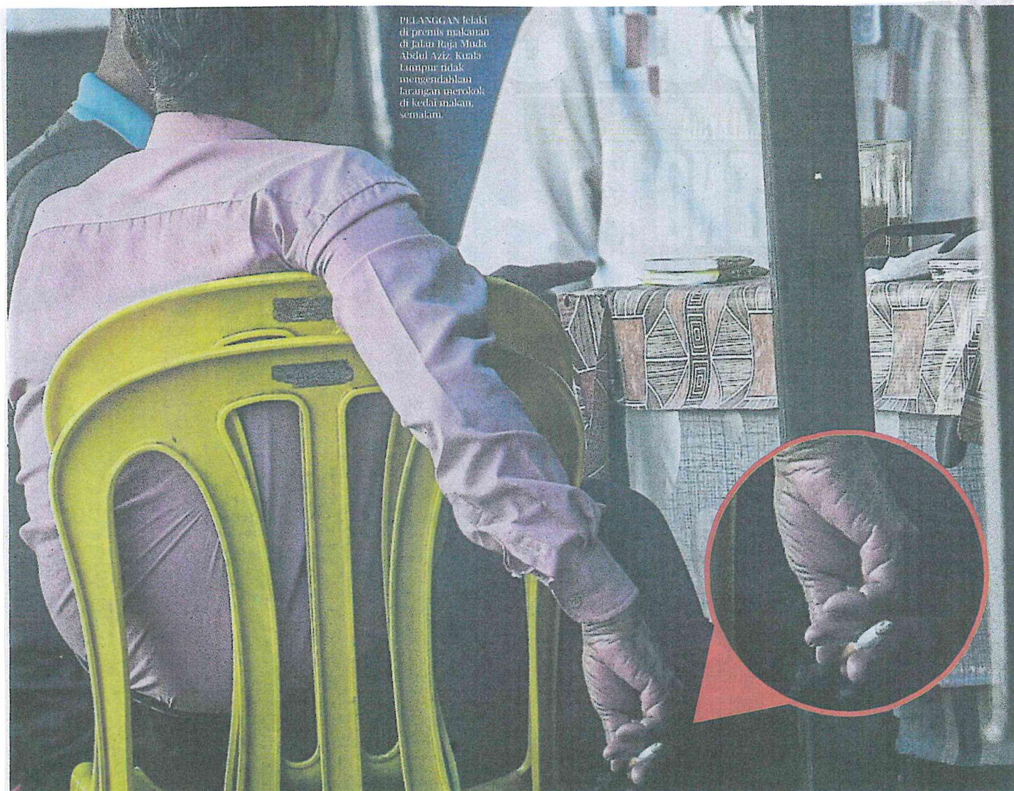
PELANGGAN lelaki di premis makanan di Jalan Raja Muda Abdul Aziz, Kuala Lumpur tidak mengendahkan larangan merokok di kedai makan, semalam.