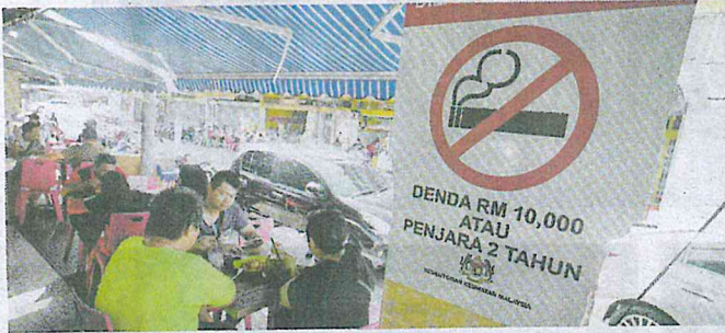
Larangan merokok dan rokok elektronik (vape) di premis makan mula berkuat kuasa semalam.

Walaupun larangan merokok di premis makanan mula dilaksanakan semalam