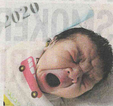
One of the babies born on New Year's Day at Tengku Ampuan Afzan Hospital in Kuantan yesterday.

the hospital at 3.15am, followed by a baby girl at 5.30am.