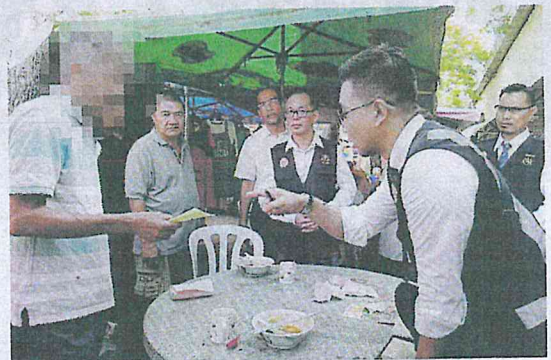
Lelaki berusia 50-an yang marah apabila diberikan notis kompaun ketika operasi penguatkuasaan larangan merokok di tempat makan di Bukit Baru semalam.

MELAKA TENGAH - "Saya panas hati, janganlah letak meja makan di luar premis, jadi tak adalah orang merokok di sini. Kalau begini, larang terus penjualan rokok," kata seorang perokok tegar yang tidak berpuas hati dikenakan sebanyak kompaun RM250.