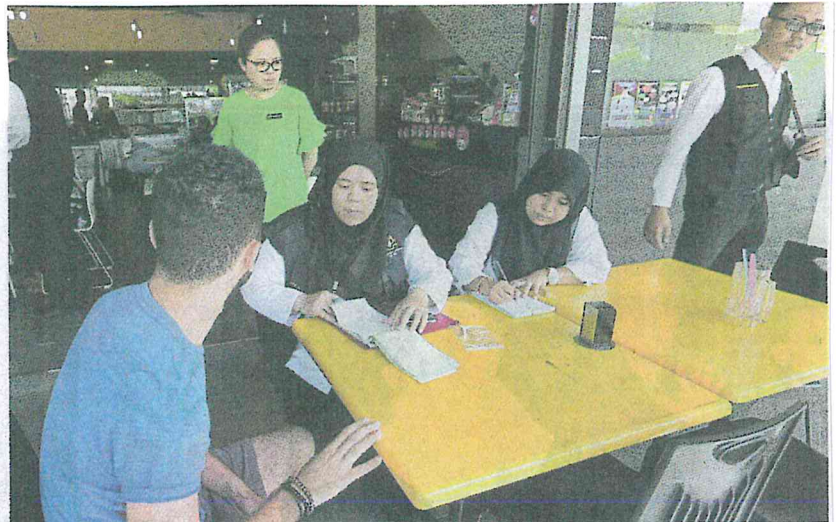
Health officers issuing a summons to a tourist for smoking in a restaurant at Dataran Larkin, Johor Baru, yesterday.

Those who commit the offence for the first time can have their