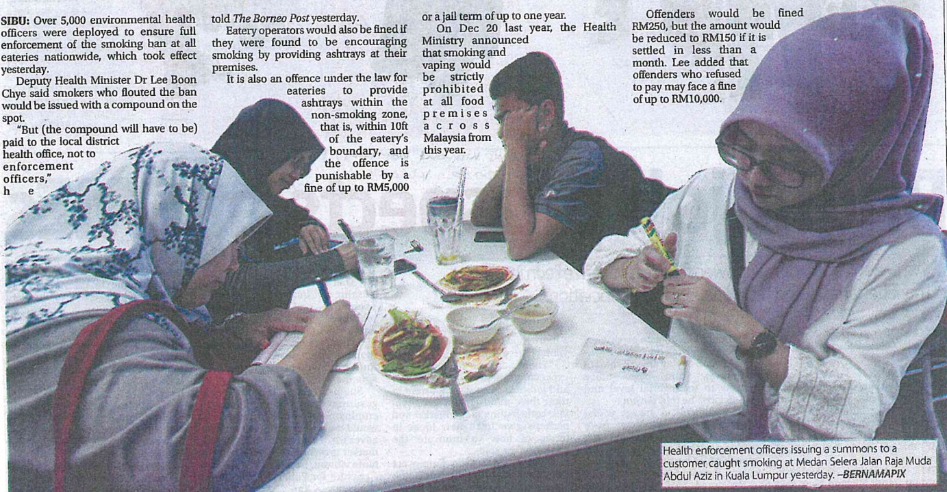
Health enforcement officers issuing a summons to a customer caught smoking at Medan Selera Jalan Raja Muda Abdul Aziz in Kuala Lumpur yesterday.

Offenders would be fined RM250, but the amount would be reduced to RM150 if it is settled in less than a month. Lee added that offenders who refused to pay may face a fine of up to RM10,000.